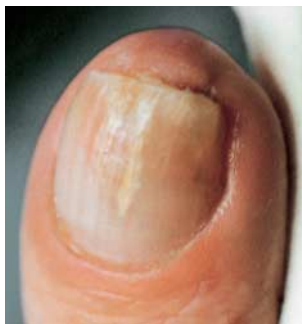
Eine Pilzinfektion hat sich zwischen Nagel und Nagelbett ausgebreitet.