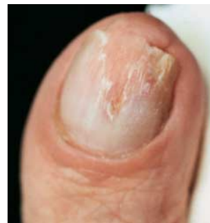
Lose Nagelteile, bei Nagelpilz alle befallenen Partien, gründlich mit einem Fräser bis herunter auf das Nagelbett abtragen.