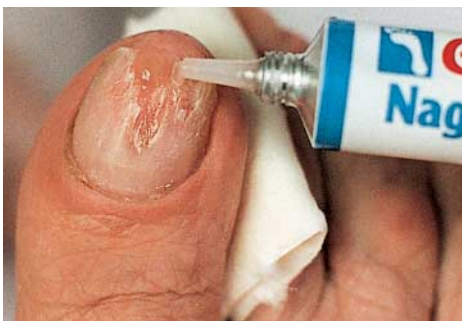
GEHWOL Nagelmasse in dünnen Schichten mit einer Trockenzeit von jeweils ca. fünf Minuten auftragen.