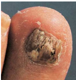
Ein Nagelpilz im fortgeschrittenen Stadium der Infektion.

Nachbehandlung: Um auch die nicht mit Nagelmasse bedeckten Partien des Nagels vor Pilzbefall zu schützen, empfiehlt sich die tägliche Anwendung von GEHWOL med Nagel- und Hautschutz-Creme oder -Öl . Beide Produkte wirken antimyzetisch, fördern das Wachstum und sorgen für gesunde, elastische Nägel.