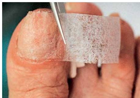
Die Nagelprothese bei Bedarf je nach Nagelstärke durch 1-2 Lagen Vlies verstärken.